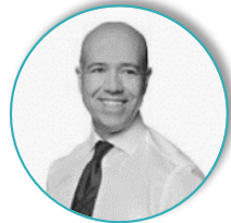
Lerro & Partners